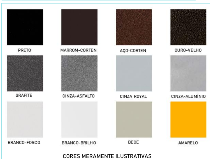
TABELA DE CORES

PENDENTE CIRCULAR PARA ILUMINAÇÃO DIFUSA NO GERAL, ESCRITÓRIOS, MESAS DE REUNIÃO, MESAS DE JANTAR, ETC.